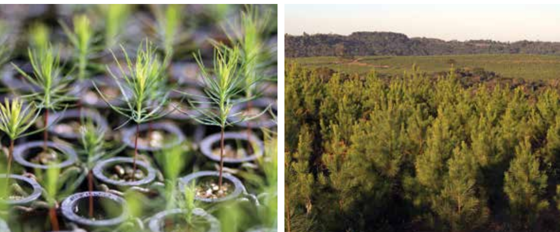
Produção de Mudas e Visão Área de Plantio Faz. Buriti

Há na unidade de manejo florestal da Fazenda Buriti, plantios com Araucária angustifolia, com 64,64 há, sendo estes adquiridos junto com a aquisição da fazenda no ano de 1987.