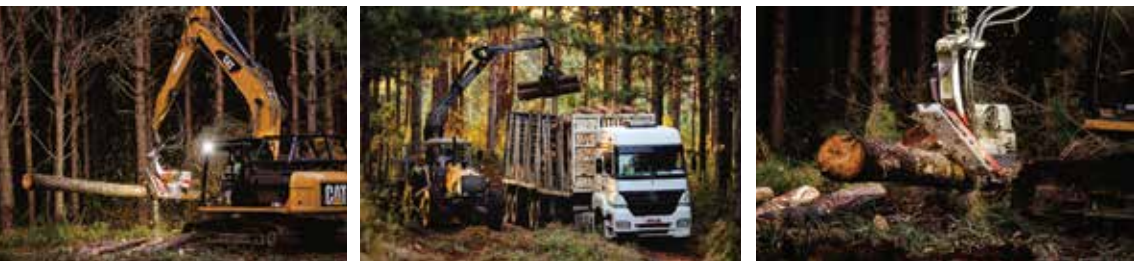
Sequência de fotos com diferentes etapas da colheita: corte, seccionamento e baldeio, em operação de Desbaste.

• Sistema de toras Curtas (Cut-to-length), a árvore é processada no local da derrubada, sendo extraída para a margem da estrada em forma de toras. O corte e processamento das árvores é realizado com equipamento tipo Harvester, desgalhe e traçamento (seccionamento em toras), no interior do talhão, e baldeio utilizando tratores agrícolas com grua e reboques auto carregáveis.