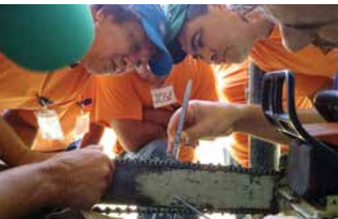
Imagens de Treinamentos diversos