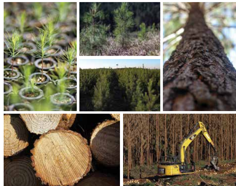
Seqüência de fotos com diferentes fases do plantio a colheita das florestas