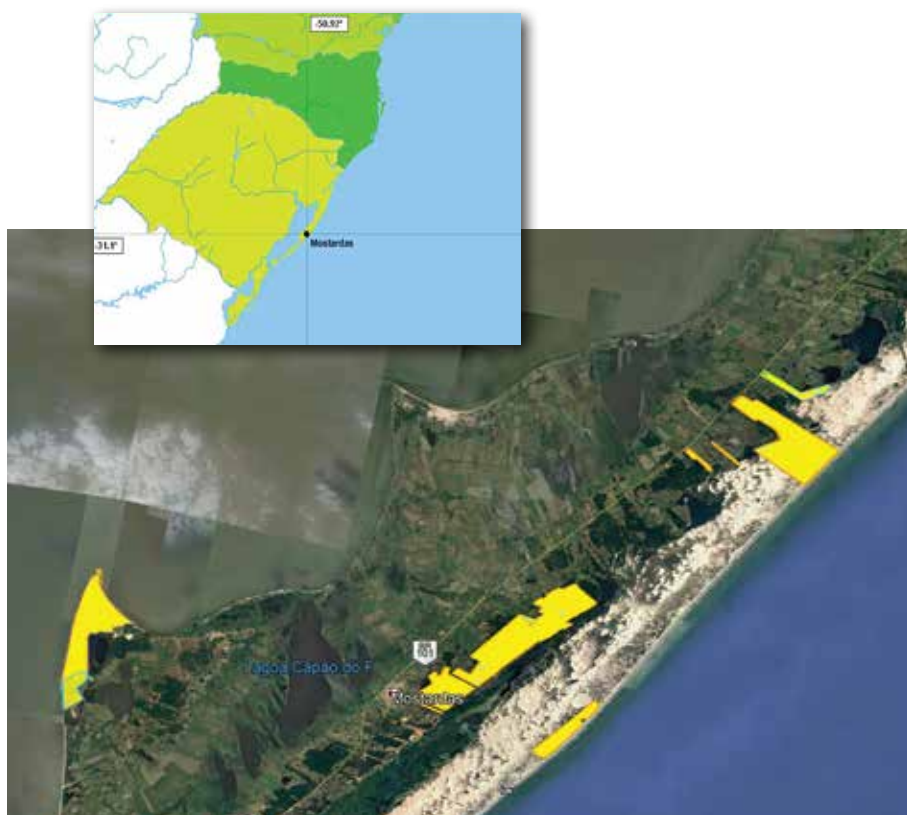
Figura 2 - Hortos florestais da Florestal Mostardas localizados no município de Mostardas-RS.

A seguir estão identificadas as fazendas presentes no escopo da Certificação de Manejo Florestal FSC Florestal Mostardas (Figura 2).