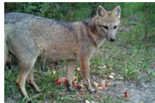
Figura 5 - registro através de armadilha fotográfica de Cerdocyon thous (Graxaim do mato).

Abaixo seguem alguns dos registros realizados: