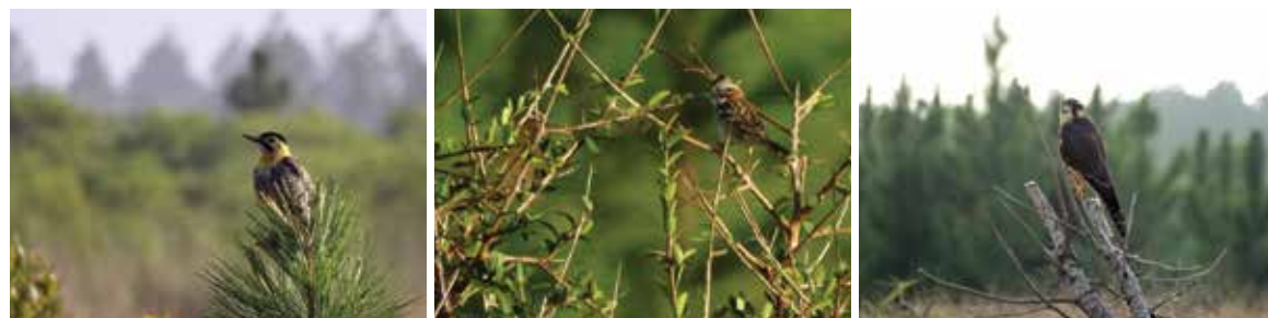
Aves avistadas em campo e florestas de Pinus nas áreas da empresa: Pica-pau-do-campo ( Colaptes campestris ), Tico-tico ( Zonotrichia capensis ), Falcão-de-coleira ( Falco femoralis ).

Participa também, por termo de cooperação através da AGEFLOR, junto ao Instituto de Pesquisas e Estudos Florestais (IPEF) onde contribui para o projeto de pesquisa chamado Programa Cooperativo de Certificação Florestal (PCCF). O referido programa busca ser o elo entre as empresas certificadas, ONGs, organismos de certificação, universidades, instituições de pesquisa, fornecedores de insumos e serviços e demais partes interessadas no processo de certificação florestal, para o tratamento dos assuntos de interesse de todos.