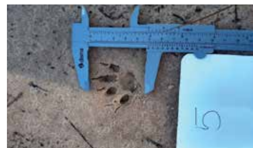
Figura 6 - pegada de Leopardus spp.