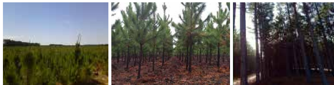
Seqüência de fotos com diferentes fases de povoamentos provenientes da regeneração do Pinus elliottii na Florestal Mostardas.

Ao iniciar a segunda rotação destas áreas, após a primeira colheita, já na década de 90, deparou-se, com a capacidade de germinação espontânea do banco de sementes depositado no solo da floresta. Adaptando-se a nova realidade, foram desenvolvidas técnicas de manejo no sentido de aproveitar este potencial na formação de novos povoamentos, partindo para o conceito de rigorosa seleção fenotípica de indivíduos, conciliando a metodologia adotada com a viabilidade econômica do manejo.