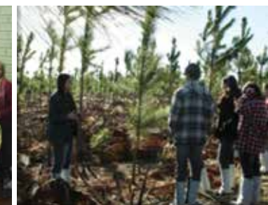
Apresentação das atividades executadas na empresa para escolas. / Alunos Lanchando no refeitório de campo / Visita de Campo com Alunos