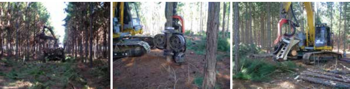
Sequência de fotos com diferentes etapas da colheita: corte, seccionamento e baldeio, em operação de Desbaste.