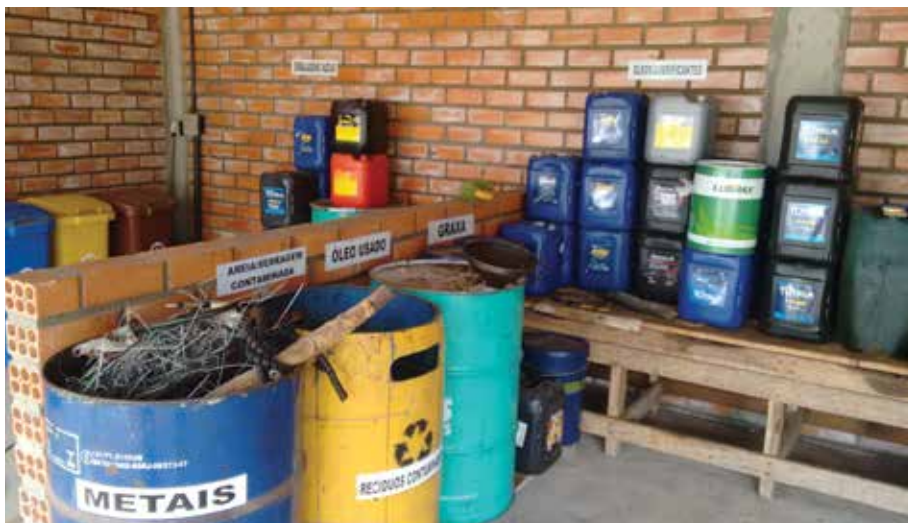
Coleta seletiva de resíduos.

A destinação de resíduos classificados como perigosos, no caso da empresa, resíduos contaminados com óleos ou graxas são transportados e destinados por empresas licenciadas pelo órgão ambiental.