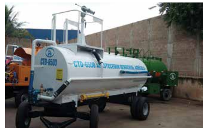
Tanque móvel utilizado para combate à incêndios.