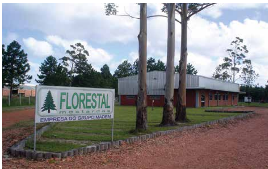
Sede da empresa localizada no Km 160 da Rodovia BR 101.

Sediada no município de Mostardas no Litoral sul do Estado do Rio Grande do Sul, a empresa faz parte do Grupo MADEM, hoje com 67 anos de história, estando entre os maiores grupos florestais do Brasil, sendo líder mundial na fabricação de bobinas de madeira para indústria de cabos elétricos.