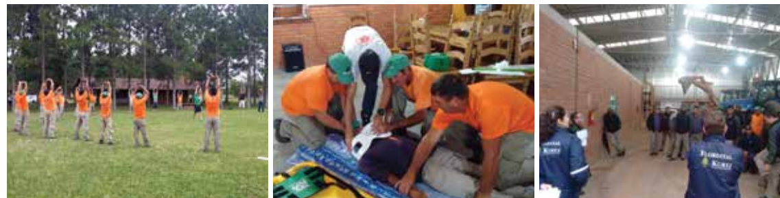
Treinamentos Florestal Mostardas de Ginástica Laboral, Primeiros Socorros e diálogos de segurança

Boa parte dos cursos de capacitação são realizados com a parceria e apoio do SENAR (Serviço Nacional de Aprendizagem Rural) juntamente com o Sindicato Rural de Mostardas.