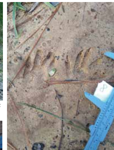
Figura 7 - pegada de Procyon cancrivorus (Mão-pelada).